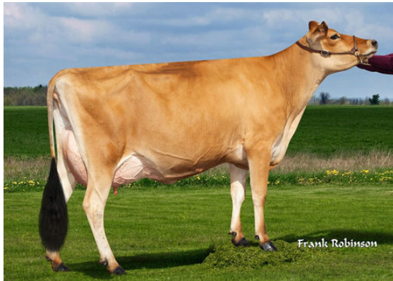
JX VIERRA PRESLEY {6}