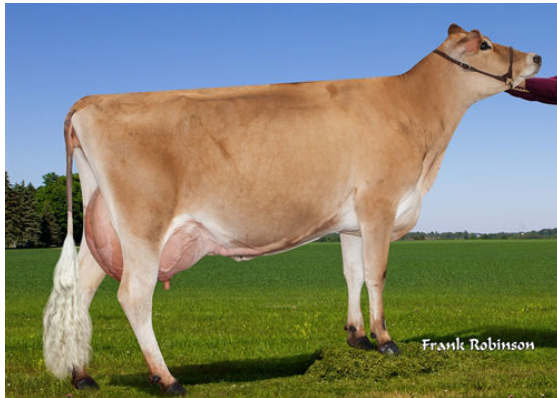
JX VIERRA ELSA {6}